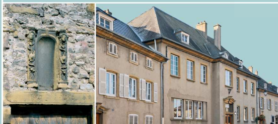
Rue Saint-Louis, ferme en ruine. Niche sculptée portant la date de 1736

Pendant la Seconde Guerre mondiale, Manom est rattachée à la commune de Thionville. Dès les années 1950, la commune entre dans une phase d'expansion largement favorisée par la proximité immédiate de Thionville. Au centre ancien (où se mêlent fermes, maisons de manouvrier et villas urbaines) viennent s'ajouter des lotissements neufs. Au début des années 1980, la population augmente de 30% avec le projet Auf Laur. À la même période, l'entreprise Scholtès est cédée au groupe italien Indesit-Merloni. Celui-ci quitte définitivement Manom en 2007. Aujourd'hui devenu Zone de l'Émaillerie, le site est appelé à court terme à renaître économiquement.