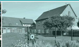
Route de Garche, école maternelle construite au début des années 1950 ; agrandie en 2008 avec la crèche Les Printaniers. Le parement des façades en pierre calcaire rappelle les maisons jumelles construites rue de la Paix en 1962.