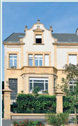
Villa avec pignon chantourné daté 1924, frise de carrelage à la base du toit, oriel percé de verre coloré à motif d'iris