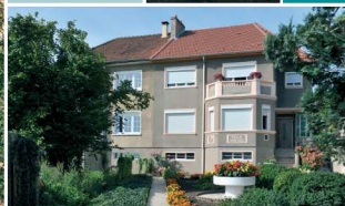
Villas jumelles portant le nom de « Villa Amédée » sur l'oriel et la date de 1956 sur un balcon en façade arrière

SAINTE-MARIE constituée d'une importante demeure (château du XVII e siècle, à l'abandon au milieu du XX e siècle et actuellement en restauration) et de quelques pavillons modernes.