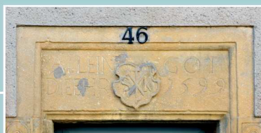
Grand'Rue. Linteau daté 1599

Manom appartient successivement au comté (puis duché) de Luxembourg (1354 à 1462) au duché de Bourgogne (1462 à 1477), puis aux Habsbourg avant d'être rattachée à la France en 1648.