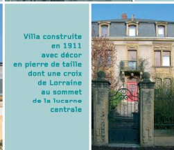
Villas construites en 1911 avec décor en pierre de taille dont une croix de Lorraine au sommet de la lucarne centrale